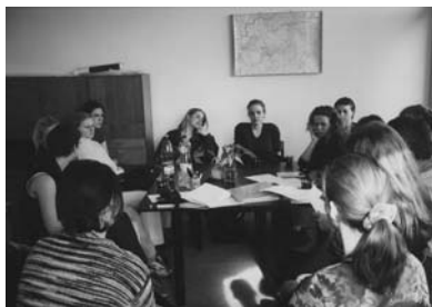
Společná schůzka v Dobrovolnickém centru

Věříme, že u mladých lidí můžeme tímto vzbudit zájem o filantropii a věci veřejné. V programu Rozvoj občanských ctností jsme se snažili jak studentům tak pedagogům poskytnout potřebné informace a pomoc při realizaci vlastních nápadů.