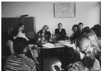
Společná schůzka v Dobrovolnickém centru

Věříme, že u mladých lidí můžeme tímto vzbudit zájem o filantropii a věci veřejné. V programu Rozvoj občanských ctností jsme se snažili jak studentům tak pedagogům poskytnout potřebné informace a pomoc při realizaci vlastních nápadů.