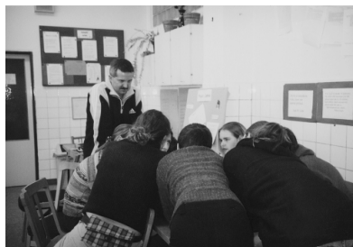
Při přípravě miniprojektů jsme dali hlavy dohromady

„Program Rozvoj občanských ctností je realizován v rámci programu Gabriel za finanční podpory Nadace rozvoje občanské společnosti a Open Society Fund Praha. Hlavním řešitelem a garantem projektu je HESTIA - Národní dobrovolnické centrum Praha. V Ústí nad Labem byl realizován Dobrovolnickým centrem.“