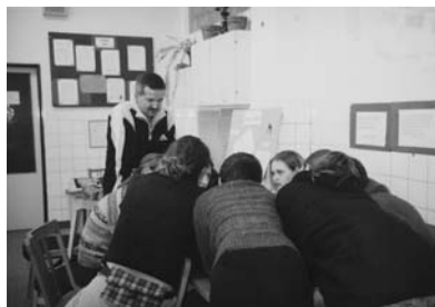
Při přípravě miniprojektů jsme dali hlavy dohromady

„Program Rozvoj občanských ctností je realizován v rámci programu Gabriel za finanční podpory Nadace rozvoje občanské společnosti a Open Society Fund Praha. Hlavním řešitelem a garantem projektu je HESTIA - Národní dobrovolnické centrum Praha. V Ústí nad Labem byl realizován Dobrovolnickým centrem.“