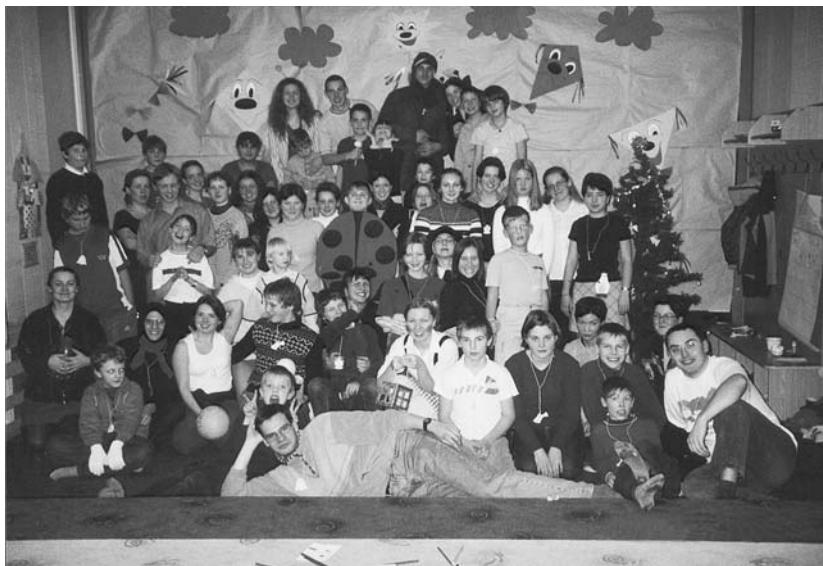
12. 12. 2002 jsme oslavili blížící se vánoce společnou besídkou. Celý program připravila skupina dobrovolníků z posledního výcviku.