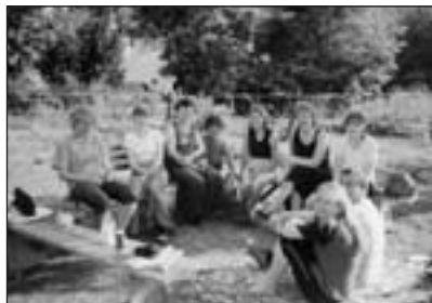
Posezení dobrovolníků v přírodě