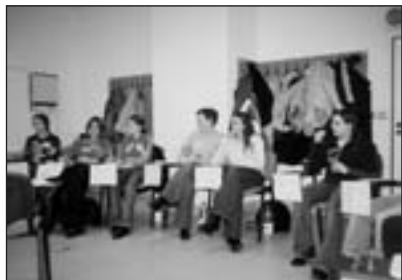
Výcvik pro Masarykovu nemocnici

Všem zapojeným dobrovolníkům a spolupracovníkům v programu děkujeme.