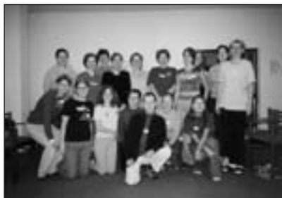
Skupina dobrovolníků na výcviku