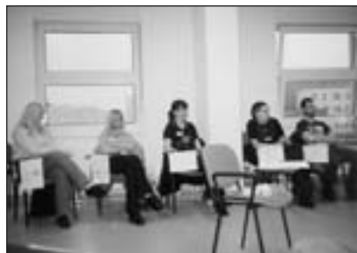
Fota z výcviku v Masarykově nemocnici