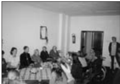
Posezení se seniory na výcviku dobrovolníků