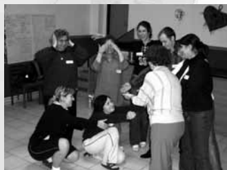
Výcvik dobrovolníků v Žandově