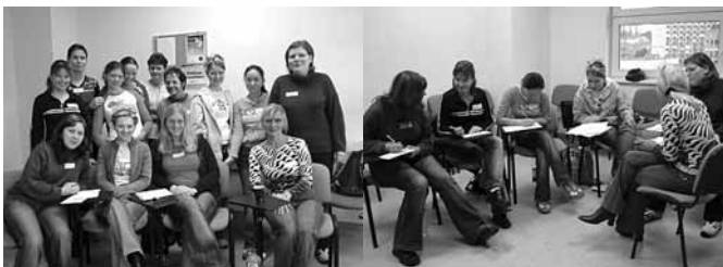
Parta připravená do Masarykovy nemocnice

Každý rok dobrovolníci přicházejí, ale i odcházejí. V roce 2004 jich bylo 18. Byla to dobrá zkušenost pro všechny, kdo mají rádi lidi, komunikaci a jsou ochotni někomu pomoci. Odměnou dobrovolníkům byl dobrý pocit, nová přátelství a zajímavá zkušenost.