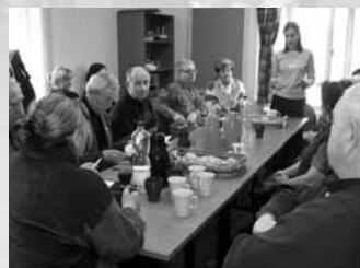
1. setkání o Radě seniorů