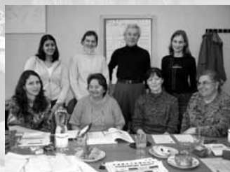
Pracovní setkání dobrovolnického týmu