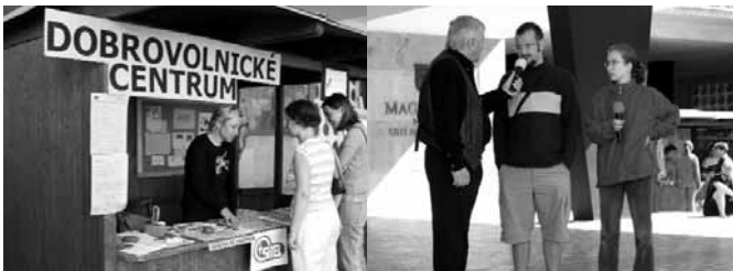
Veletrh sociálních služeb ve městě Ústí nad Labem