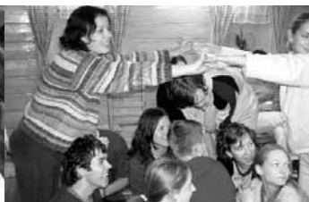
Klub Dobroš 9. října - líčení sama sebe - kurz batikování Víkendový výcvik dobrovolníků z gymnázií v Děčíně a Teplících - 5.- 7.11.

Program Rozvoj občanských čtností středoškoláků byl uskutečněn s podporou Evropského společenství. Obsah tohoto projektu nemusí vyjadřovat stanovisko Evropského společenství či Národní agentury ani nezakládá odpovědnost z jejich strany (Agentura Mládež), projekt byl dále podpořen v rámci dotačního programu Ústeckého kraje.