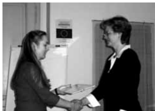
Předávání certifikátů účastníkům projektu

Projekt měl dobré výsledky zejména v tom, že pomohl k profesionálnímu růstu NNO a posílil komunikační dovednosti účastníků směrem ke komerčnímu sektoru a samosprávě. V neposlední řadě posloužil k výměně rad a informací mezi samotnými účastníky projektu.