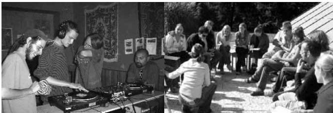
Projekt "Hudbou proti nudě a neinformovanosti" - výuka mixování elektro-nické hudby v Roudnici nad Labem

K termínu uzávěrky k podání žádostí o grant se sešlo celkem 18 projektů. Regionální hodnotící komise a následně komise v Praze rozhodla o podpoře nejlepších projektů. Bylo podpořeno celkem 10 projektů mladých lidí z celého Ústeckého kraje. Na projekty bylo rozděleno celkem 250.000,- Kč. (seznam a anotace podpořených projektů na www.dcul.cz ).