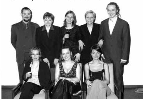
t m Dobrovolnického centra