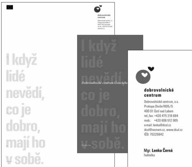
ukázka dopisního papíru a vizitky

I když lidé nevědí, co je dobro, mají ho v sobě.