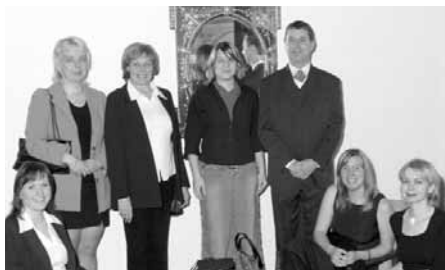
Vybraní dobrovolníci za rok 2004

Cenu Křesadlo předávají lidé z komerční i státní správy. Lidé, kteří dobrovolnictví fandí.