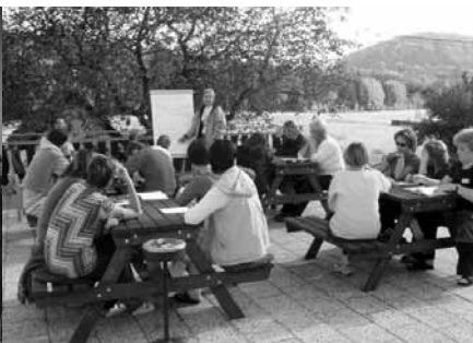
Maxov u Sloupu v Čechách - říjen 2004