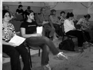
2. setkání o Radě seniorů