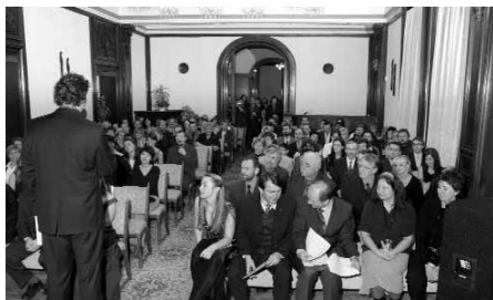
Předávání Křesadel 2004 se zúčastnilo 140 lidí.