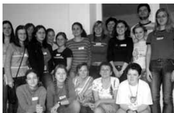
výcvik v DD Severní Terasa

Tato činnost je přitažlivá pro ty, kteří mají zájem o přátelský vztah se seniory. Obyvatelé zařízení hledají osobního společníka pro volný čas, či doprovod na procházky. Dobrovolníci nabízejí mnoho dovedností. Mezi dobrovolníky byli lidé různého věku a profese. Studenti středních a vysokých škol získali nové zkušenosti v komunikaci se seniory. Každý z nich do činnosti přinesl kus své osobnosti, což bylo užitečné hlavně pro klienty, ale i pro personál.