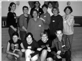
Dvougenerační dobrovolnický tým