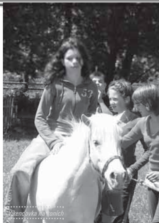
..... Víkendovka na koních .....