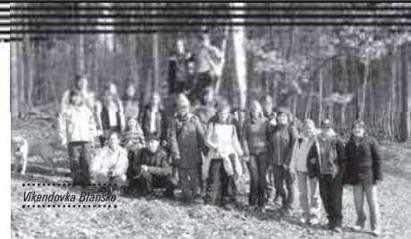
..... Víkendovka Blansko .....