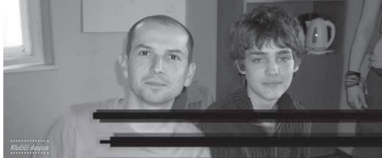
..... Klubičky dvojice .....