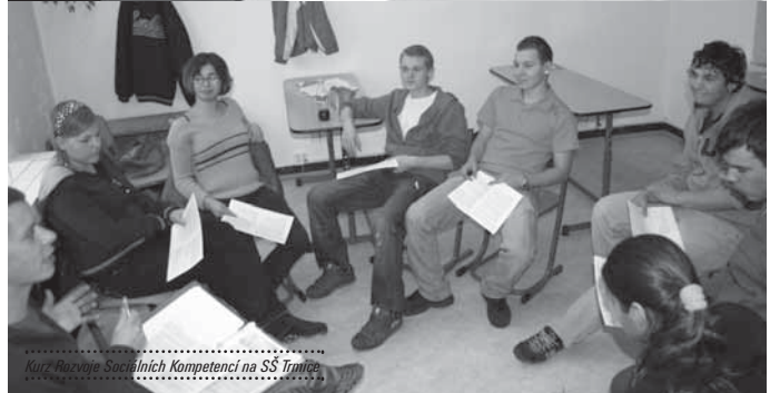
Kurz Rozvoje Sociálních Kompetencí na SS Trmice