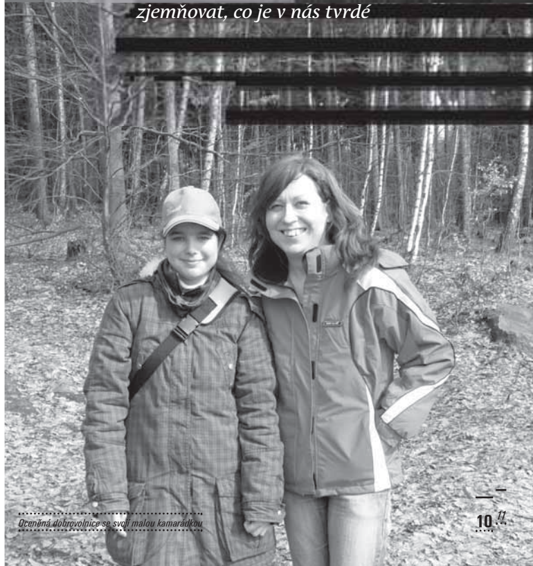
..... Oceněná dobrovolnice se svou malou kamarádkou .....