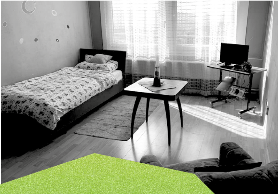
1 BYT PŘIPRAVENÝ K ZABYDLENÍ