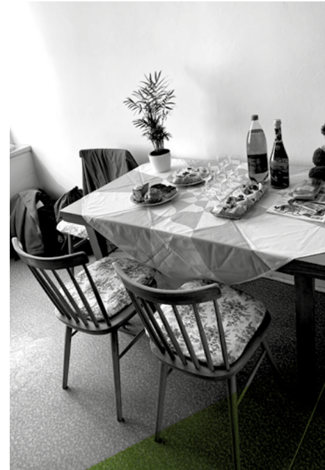
2 OSLAVA PŘI ZABYDLENÍ